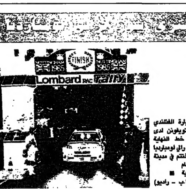
سيارة الفنتدي هنري تويونن ادي يجتاز خط النهاية للفوز في رالي لومبارديا الذي اختتم في مدينة تويوننم الاكاديمية

دعا الاتحاد الرياضي للجامعات للمشاركة في دورة الشتاء التي يقامها اعتبارا من الساعة الثانية بعد ظهر السبت ٢١ الجاري وتتضمن سباقا في الضحية للذكور والانث (الانثوية المركزي في جوية